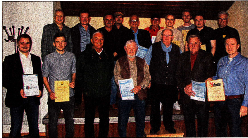
Zahlreiche Mitglieder wurden vom FC Oberpöring für ihre langjährige Treue ausgezeichnet.