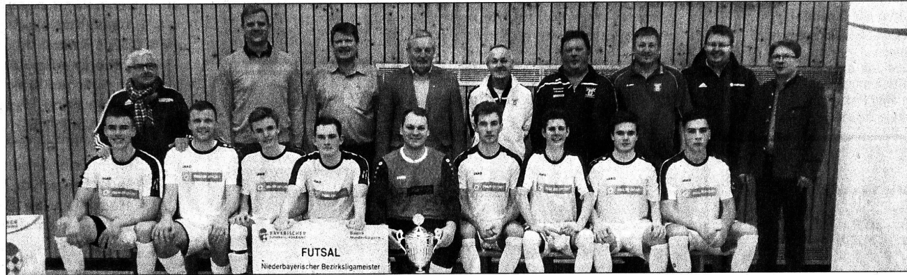
Der Wanderpokal bleibt in Deggendorf: die Spieler des neuen Futsal-Bezirksmeisters Grün-Weiß Deggendorf mit den Sponsoren und Organisatoren.

Pünktlich um 16 Uhr konnte unter der Leitung der beiden Unparteiischen Stefan Dorfner vom SC Falkenfels und Manuel Piermeier vom WSV St. Englmar das Spiel be-