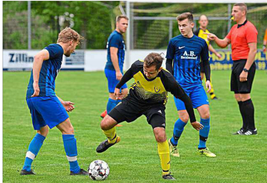
Harter Brocken zum Abschluss: Am letzten Spieltag muss Oberpörling den zweiten Platz in der Partie gegen den designierten Meister SC Falkenberg verteidigen.

Die frühe Führung verleitete die Heimmannschaft dazu, Tempo aus dem Spiel zu nehmen, so dass die Gäste besser ins Spiel kamen. Torhüter Greiner musste sein Können unter Beweis stellen, um den Ausgleich zu verhindern. Als in der Halbzeitpause der klare Rückstand des FC Wallersdorf bekannt wurde, gab das offenbar ei-