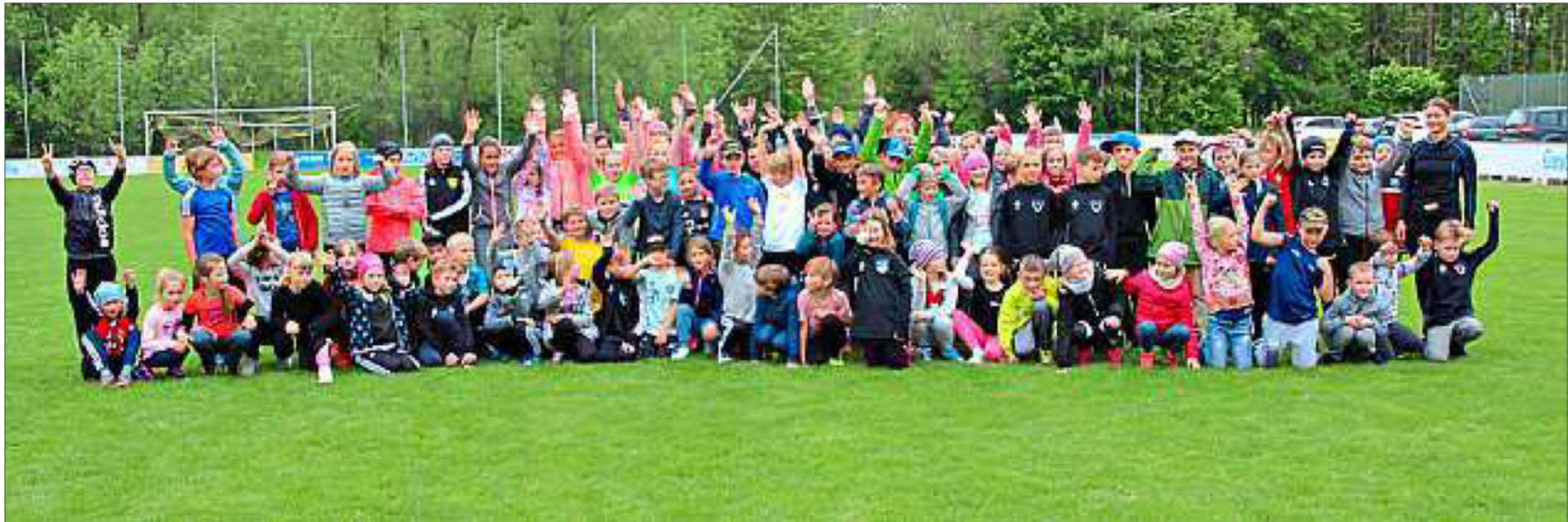
Die Hände zum Himmel streckten die Grundschüler, die sich an der Lauf-Challenge beteiligten.