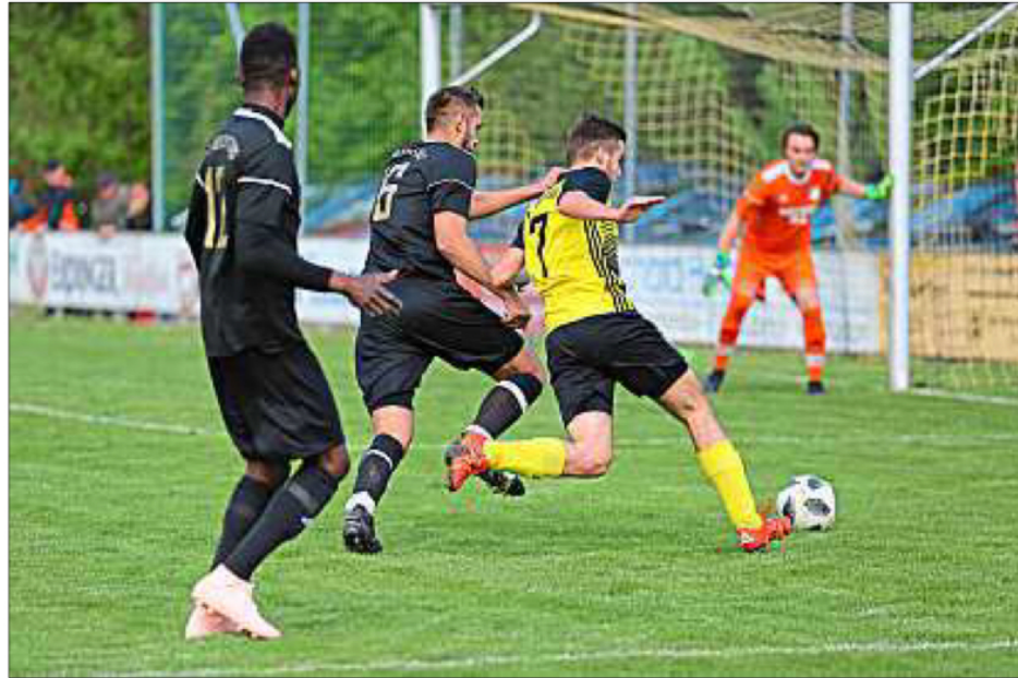
Den Sieg wollten beide , am Ende bekam ihn der FC Oberpörlng, der den 1. FC Reichstorf mit 2:0 nach Hause schickte.

Das Spiel weist ein hohes Tempo auf und beide Abwehrreihen haben mächtig zu tun, um die Stürmer am Einschuss zu hindern. Die Gäste versuchen mit hohen Bällen ihren Torjäger in Szene zu setzen, während Oberpörlng durch ein Flachpassspiel versucht, den Ball Michael Skornia in den Lauf zu spielen. In der 40. Minute geht ein Raunen durch den Isar-Sportpark. Michael Skornia tritt in aussichtsreicher Position