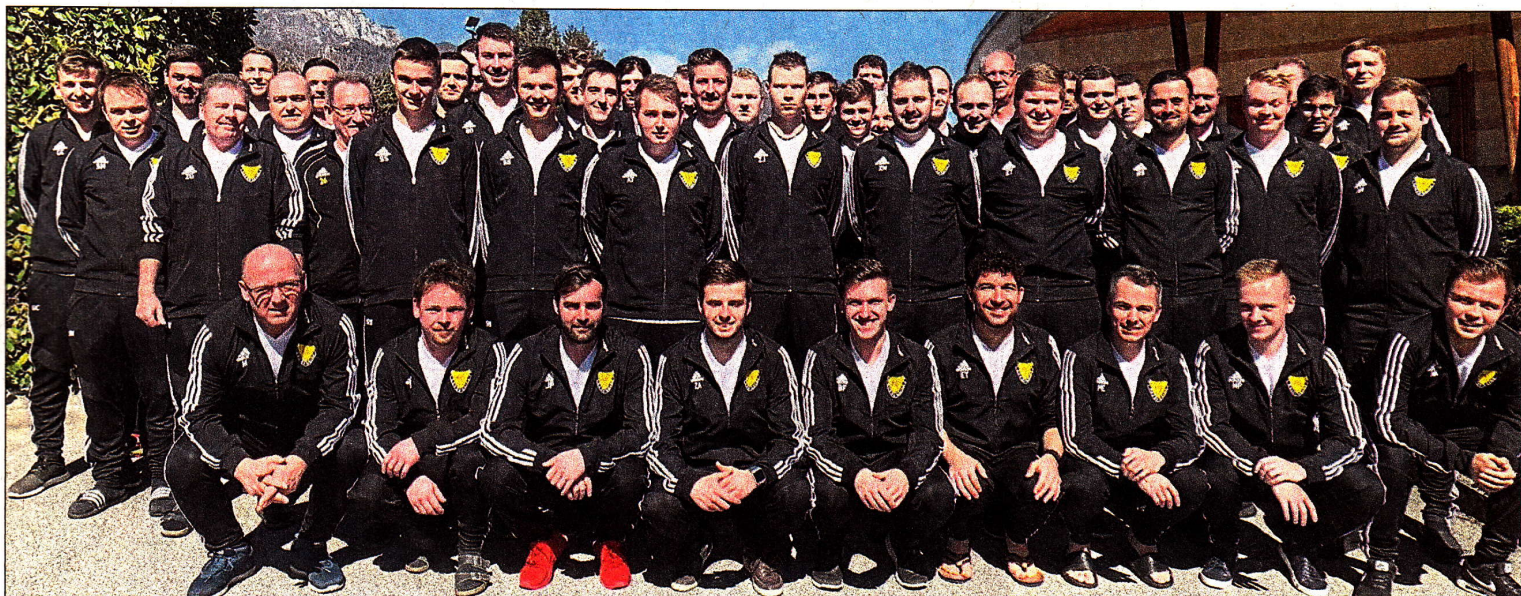
Mit mehr als 50 Sportlern und einigen Fans machte sich der FC Oberpörling auf ins Trainingslager in Riva del Garda am Gardasee.